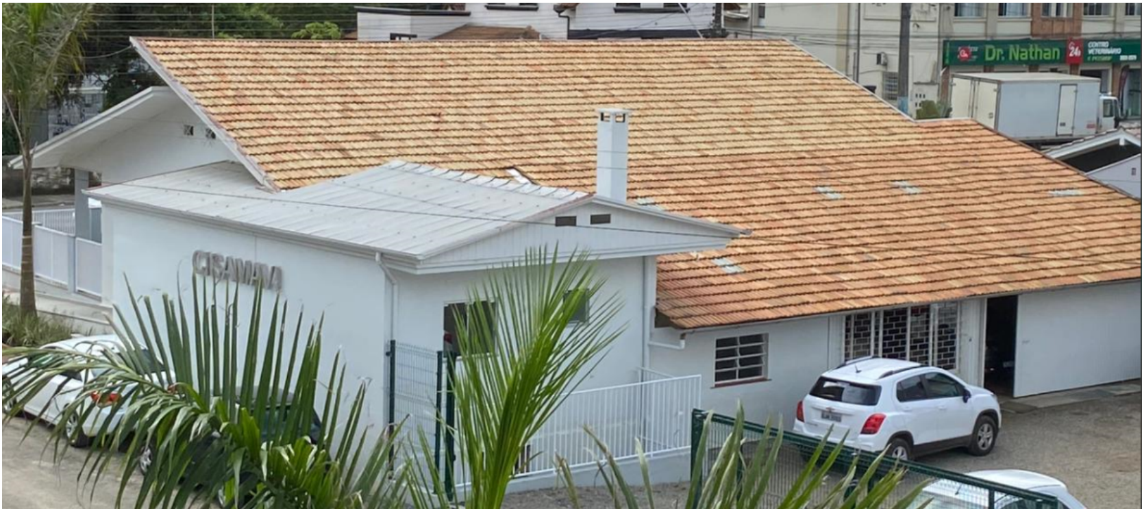
IMAGEM DO LOCAL